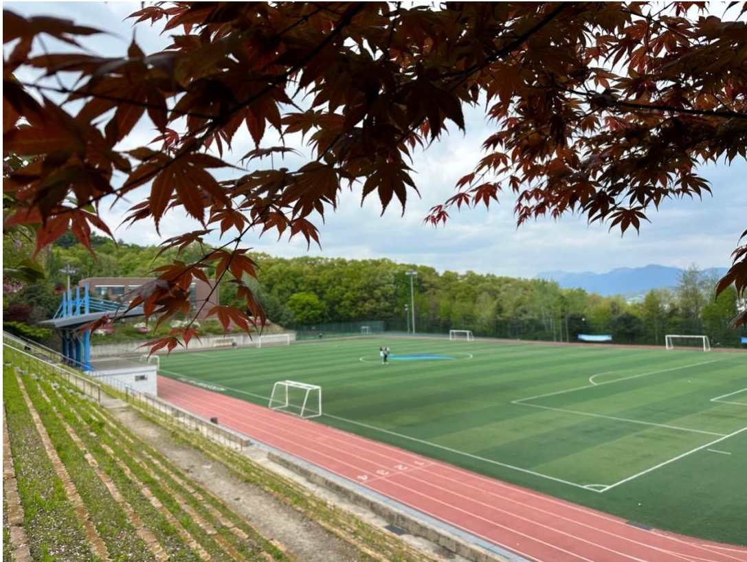
Fotballbanen på Hallym