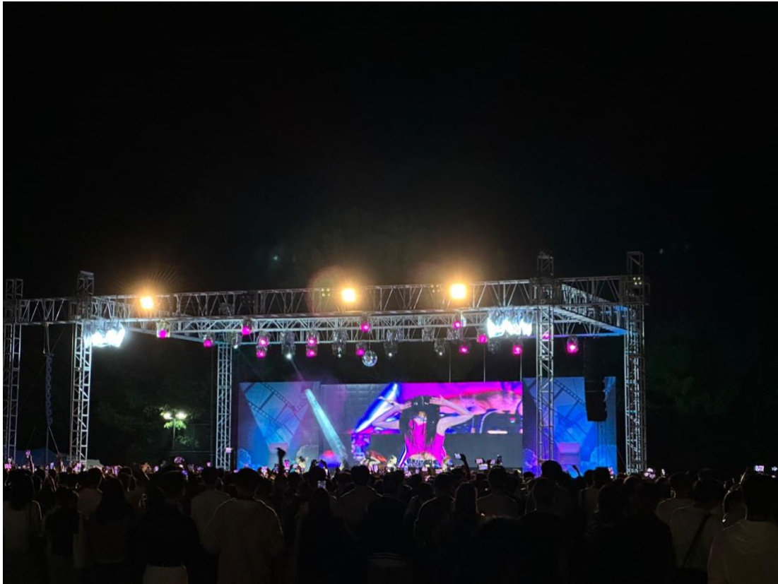
Konsert under den årlige 3 dager skolefestivalen! (Kpop artister kommer!)