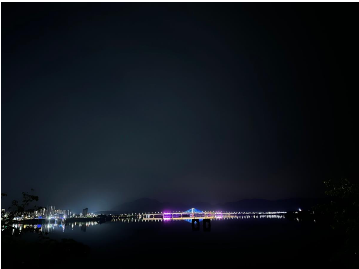
Begge broene i Chuncheon lyser opp på natten