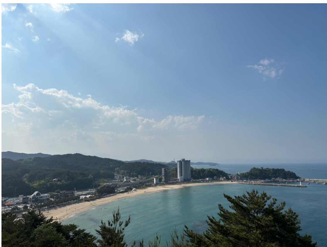
Strand i nærheten av Sokcho, øst for Chuncheon