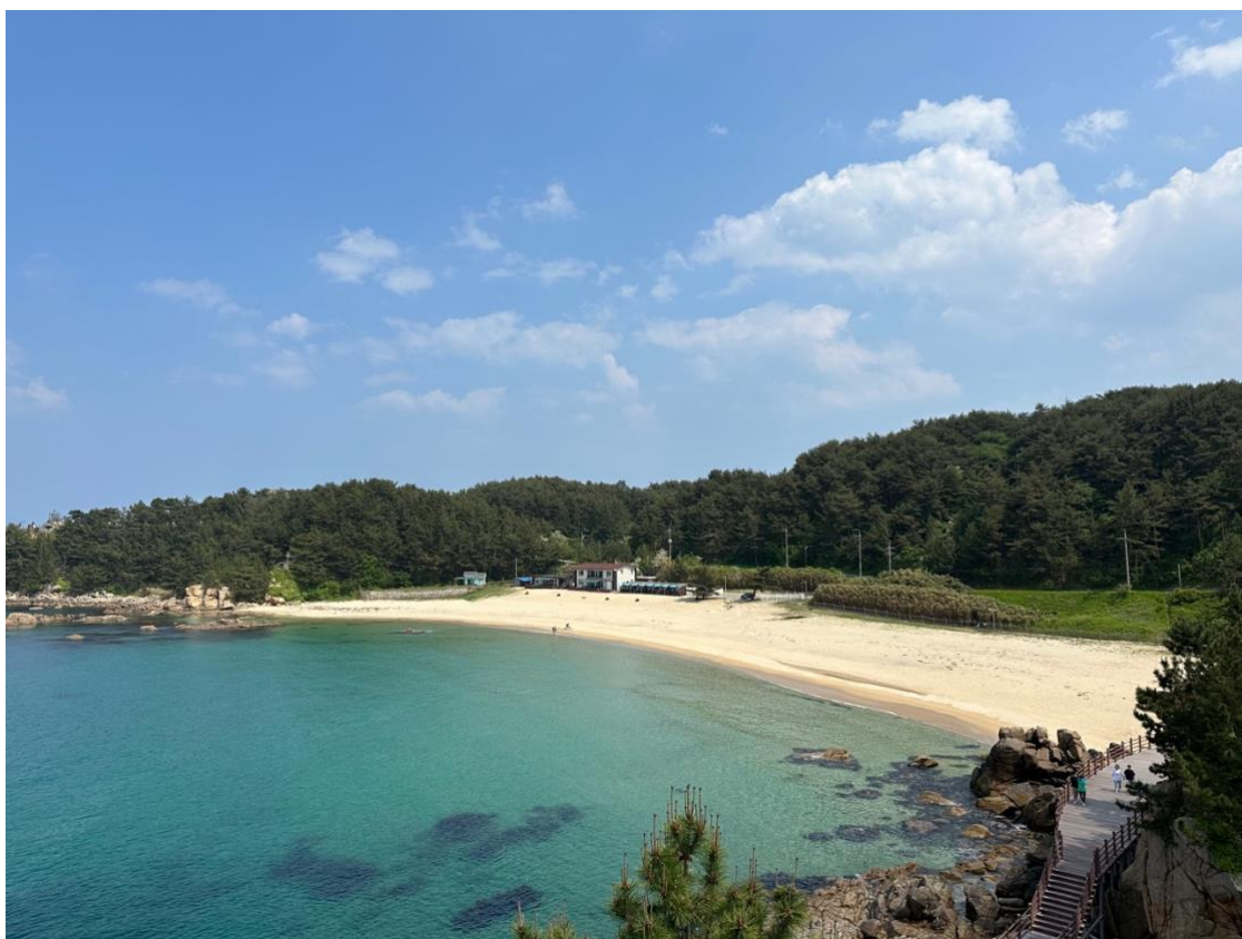
Strand i nærheten av Sokcho, øst for Chuncheon