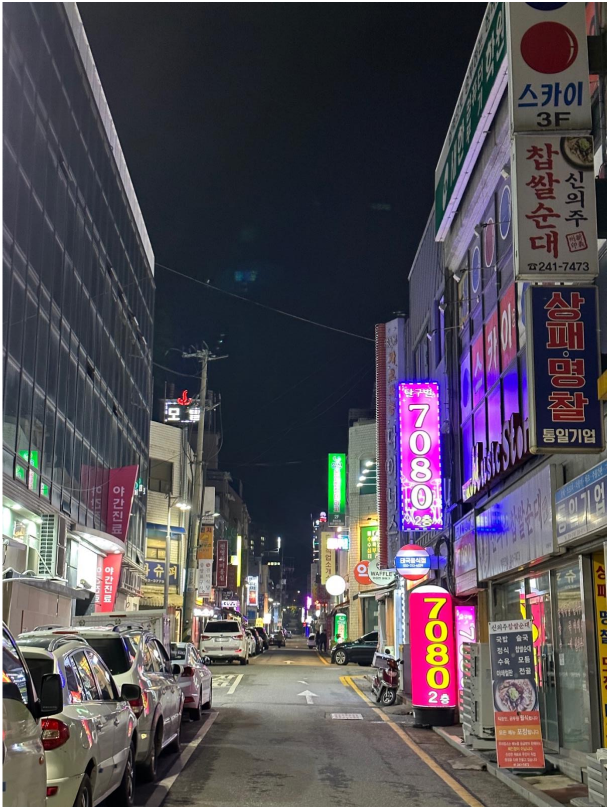
Tilfeldig gate i Chuncheon