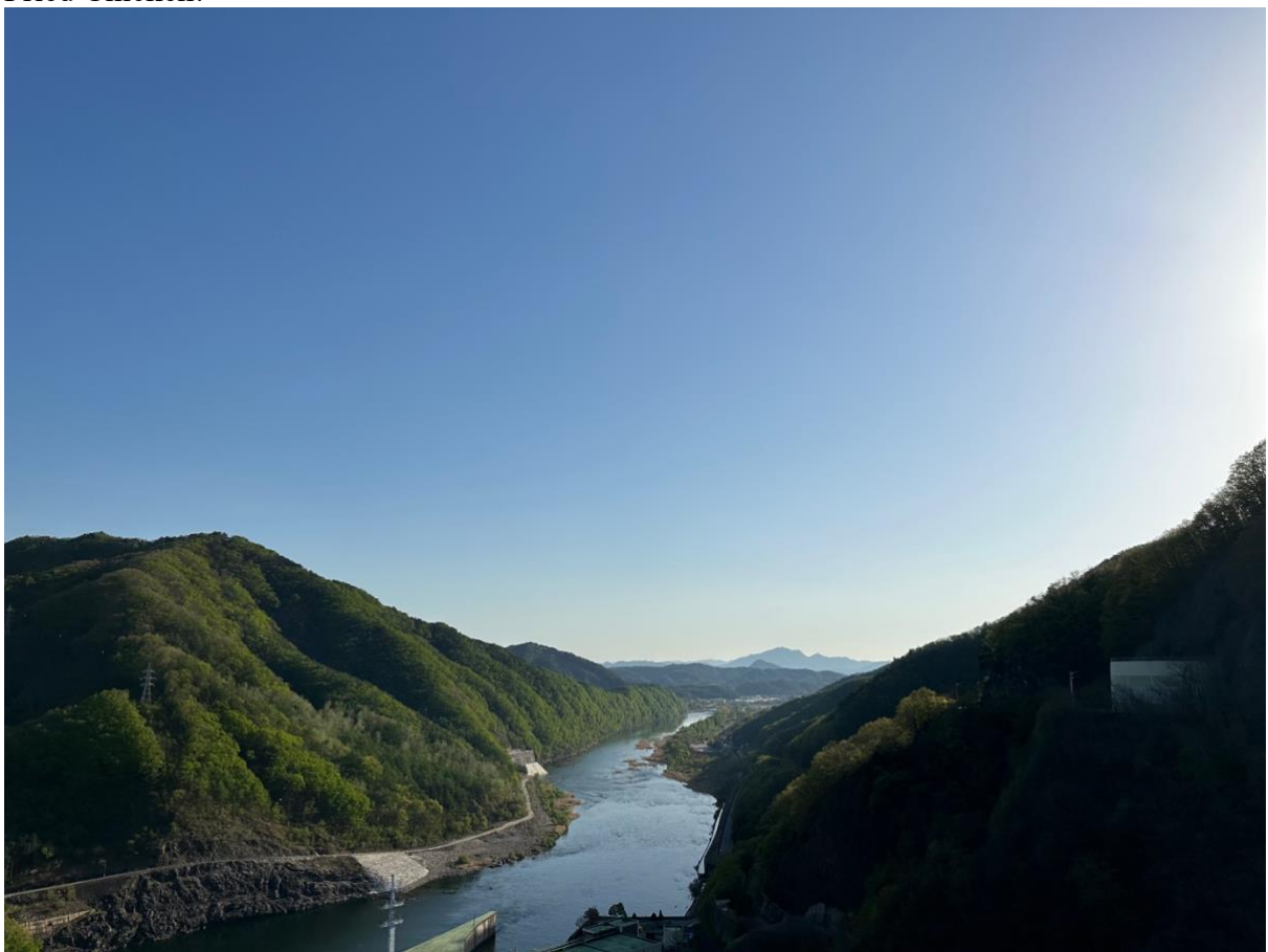
Demning en liten sykkeltur nord for Chuncheon