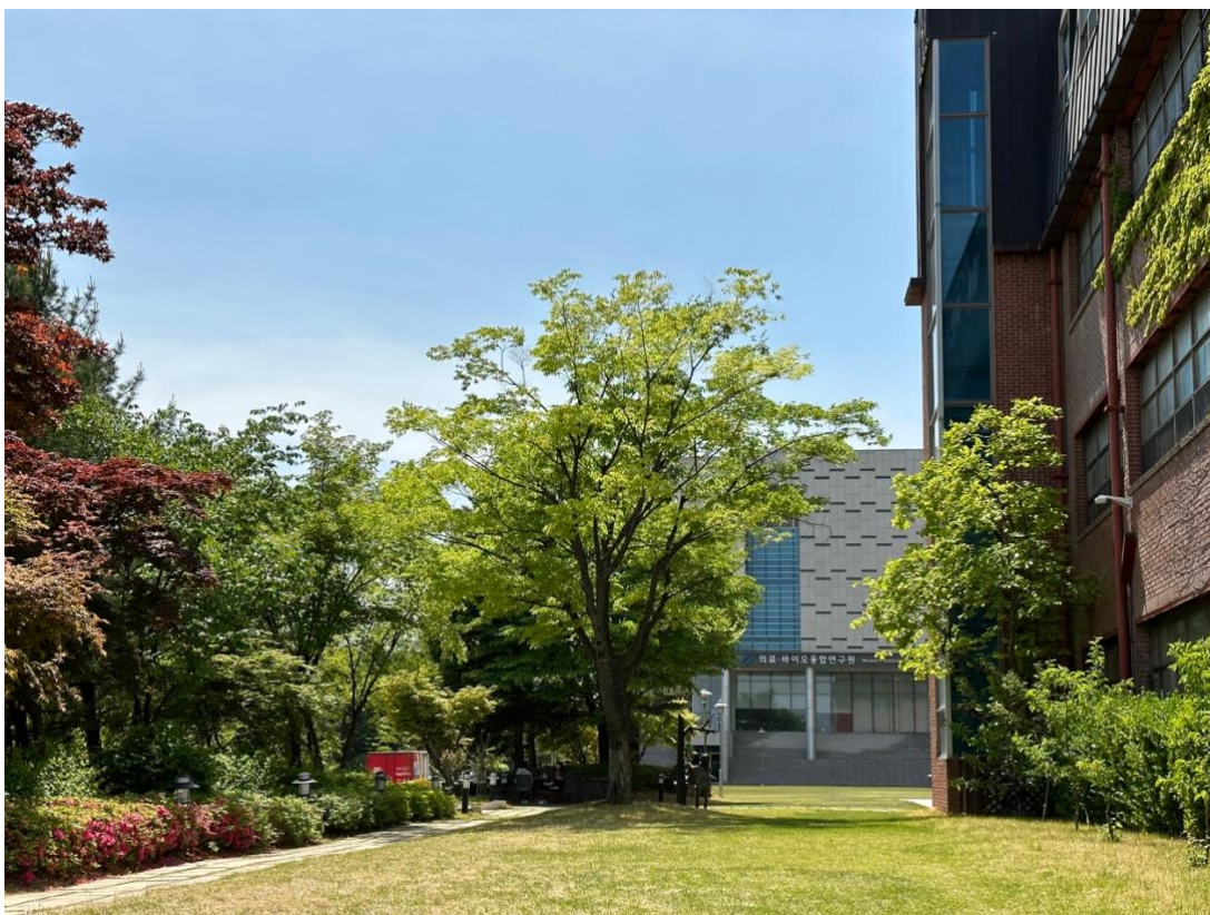
Utsikten rett utenfor Staff canteen