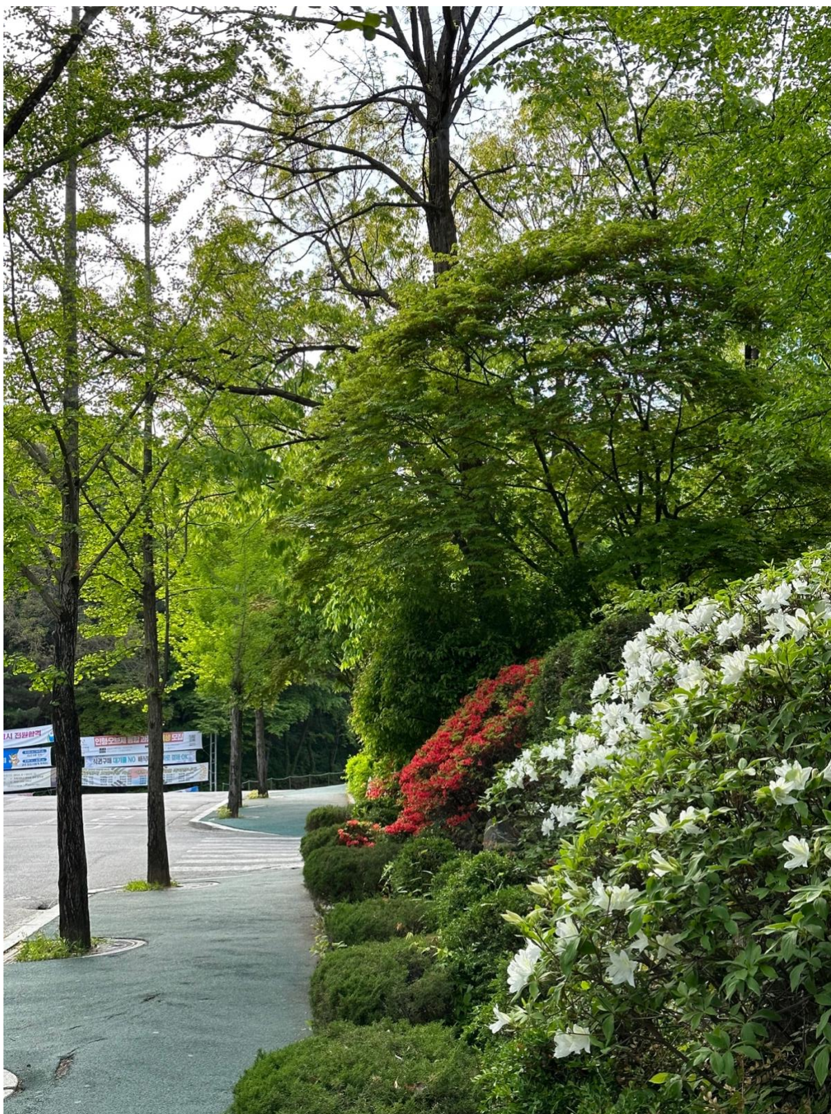
Veien fra HID opp til Staff canteen